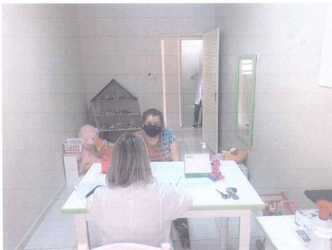
FIGURA 2 - ATENDIMENTO COM A PSICÓLOGA