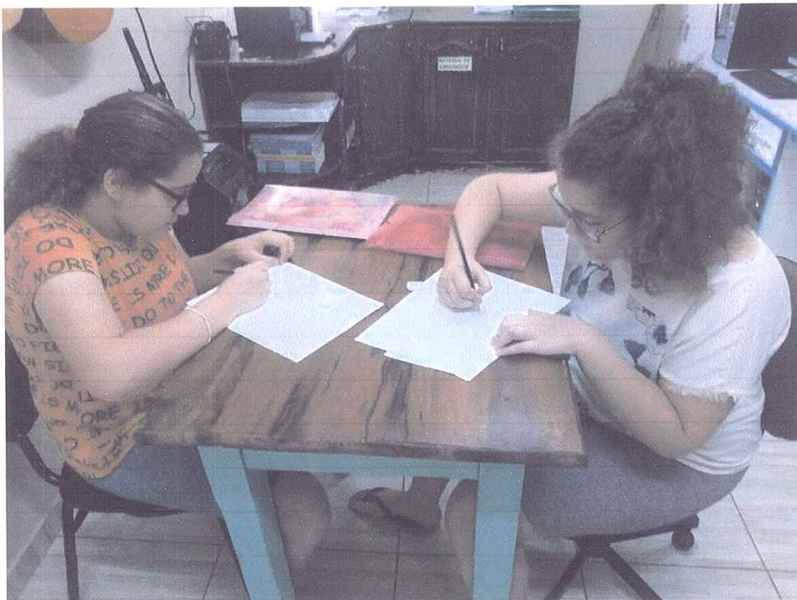
FIGURA 1 - ATENDIMENTO PEDAGÓGICO